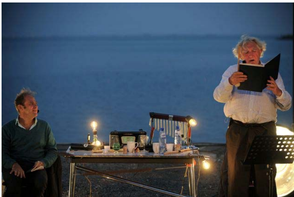
Lex de Meester©

Wie graag eens kopje onder wil gaan in een onverwoordbaar fijne en kleurrijke woordenstroom, stopt nu beter met lezen, rept zich naar Zeeland, knokt zich aan de kassa een weg door de massa, kijkt de kassadame doorborend in de ogen tot ze bezwijkt en het laatste kaartje voor Onder het Melkwoud uw richting uitschuift. Missie geslaagd.